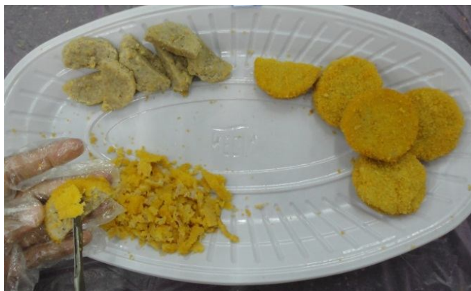
شکل ۱. جداسازی روکش در تیمارهای روکش، ناگت بدون روکش و ناگت

فیزیکی و آنالیز حسی، ناگت‌ها به مدت ۳ دقیقه در سرخ‌کن تحت دمای ۱۸۰ درجه سانتی‌گراد به صورت عمیق در روغن کانولا سرخ شدند.